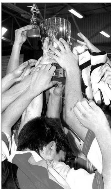
Begehrtes Objekt: 2007 holte sich Hertha BSC Berlins Nachwuchs den Freeway-Cup.

11.33 Uhr 1. Gruppe 4 - 4. Gruppe 3 (Spiel 1); 11.53 Uhr 1. Gruppe 3 - 4. Gruppe 4 (Spiel 2); 12.13 Uhr 2. Gruppe 2 - 3. Gruppe 1 (Spiel 3); 12.33 Uhr 2. Gruppe 1 - 3. Gruppe 2 (Spiel 4); 12.53 Uhr 1. Gruppe 2 - 4. Gruppe 1 (Spiel 5); 13.13 Uhr 1. Gruppe 1 - 4. Gruppe 2 (Spiel 6);