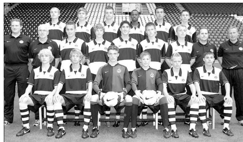
Der Nachwuchs der Borussia aus Dortmund will die Finalteilnahme aus dem Vorjahr bestätigen.