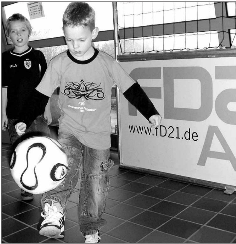
Die Ball-Jonglage am Stand des Förderprojekts FD21 erfreute sich gerade bei den jungen Fans großer Beliebtheit.