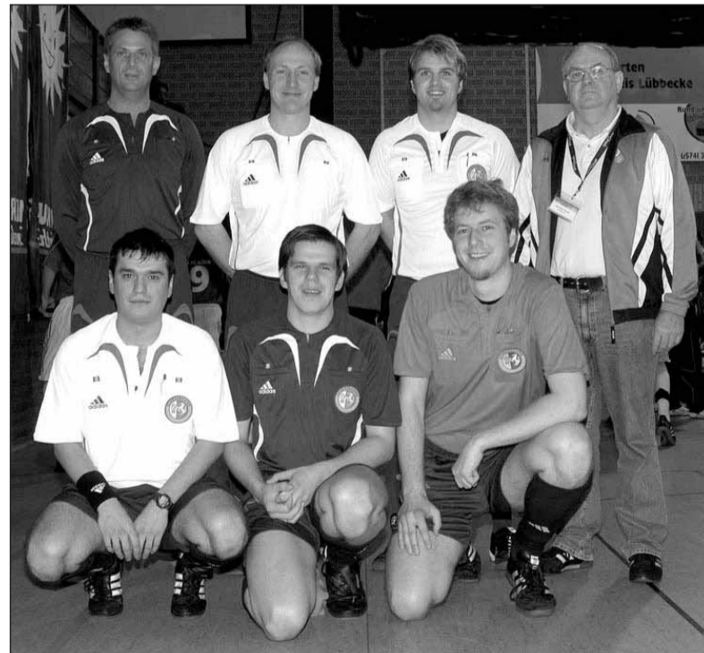
Hatten alles im Griff: Die Schiedsrichter des Freeway-Cups wurden diesmal auch nicht mit Papierkügelchen beworfen...

Zewa Wisch-&Weg? Ausgerechnet in der in diesem Jahr eh schon verkürzten Aufwärmzone war es zwischenzeitlich feucht - aber auch dieses Problem war mit Hilfe des Hausmeisters schnell behoben. Ob es sich bei der Nässe um Regenwasser gehandelt hat oder doch