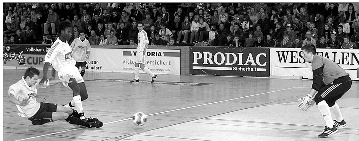
In den beiden ersten Vorrundenspielen schnupperten die Mühli's jeweils am Sieg. Auch in der Partie gegen den 1. FC Köln hatten die Mühlenkreiser etliche große Chancen.

Lübbecke (WB). Deutschland sucht den Superstar abseits des Tokio Hotels: Ähnliche Kreisfanfälle und Jubelstürme wie bei den Musiksternen dieser Zeit gab es am Wochenende rund um die Mühlenkreisauswahl. Gespielt, gefeiert, gewonnen – Herzen zumindest: Im Turnier reichte es für die Kreisauswahl zur Achtelfinalteilnahme.