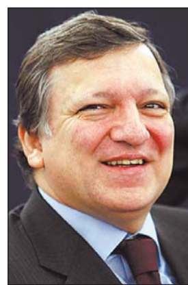
José Manuel Barroso ist Chef der EU-Kommission.

Die Beamtengehälter werden nach einem Verfahren angepasst, das der Ministerrat 2004 selbst beschlossen hatte. Die Methode berücksichtigt die Gehaltsentwicklung in acht großen Mitgliedstaaten der EU und die Kauf-