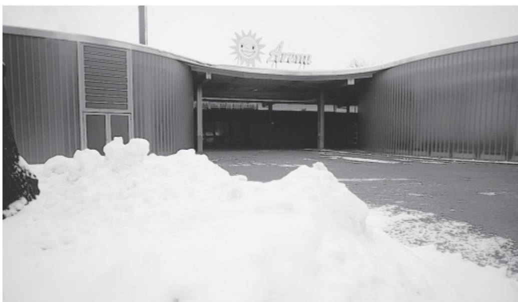
Der Eingangsbereich ist geräumt: Die Zuschauer des FreewayCups werden trockenen Fußes die Halle erreichen können.

nerlei Bedenken angemeldet“, so Gast weiter. „Wir müssen natürlich auf alles vorbereitet sein und beobachten den Wetterbericht ganz genau. So wies es aktuell aussieht, ist ja nicht mehr mit