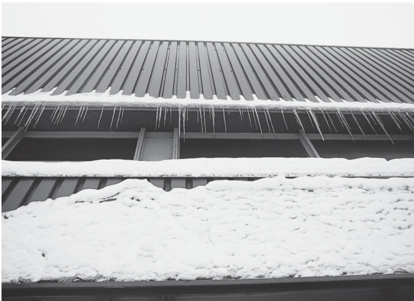
Dach vom Schnee befreit: In der Lübbecke Kreissporthalle kann am kommenden Samstag und Sonntag die 11. Auflage des FreewayCups ausgetragen werden.

Die HSG Hüllhorst hatte schon einmal vor zwei Jahren ein Lübbecke Vorbereitungsspiel gegen die HSG Nordhorn organisiert und ausgerichtet. Auch dieses Mal erklärten sich die Hüllhorster Verantwortlichen dazu bereit.