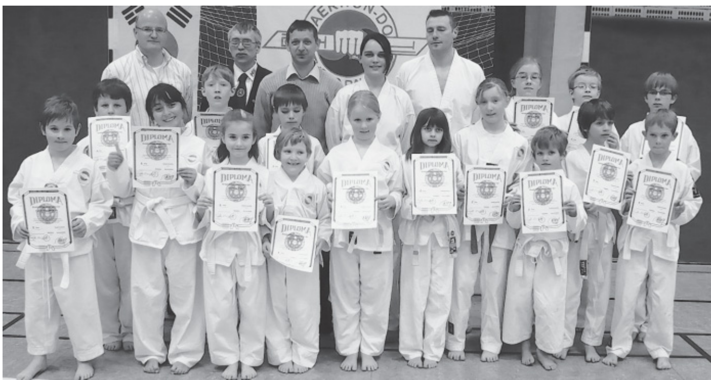
Stolz: Die Kampfsport-Talente, die ihre Prüfungen erfolgreich in Rahden ablegen konnten.