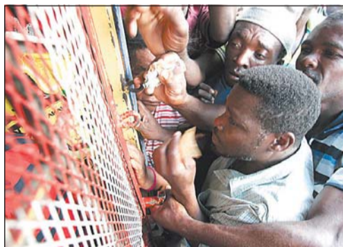
Mit Geldscheinen in der Hand drängen sich Menschen vor dem Gitter eines Lebensmittelgeschäfts in Port-au-Prince.