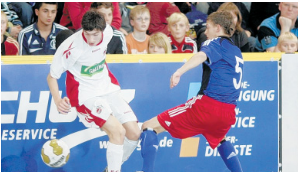
Packender Zweikampf: Im Endspiel schenken sich die Kölner und Hamburger nichts, immer bewundernd beäugt von den zahlreichen jungen Zuschauern in der Kreissporthalle.

ter), was sich in den Viertelfinale-Begegnungen zwischen Schalke und Köln sowie Stuttgart und Bayern München fortsetzte.