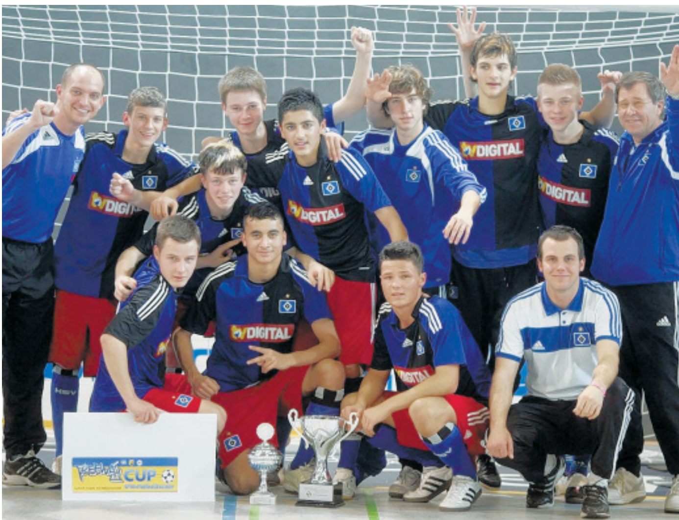
Überglücklicher und verdienter Sieger: Der u-16-Nachwuchs des Hamburger SV setzte sich im Finale 3:1 gegen den 1. FC Köln durch und freute sich anschließend über den großen Pokal.

Dramatische Begegnungen entwickelten sich bereits im Achtelfinale (Leverkusen und die Mühlenkreisauswahl kamen nach Neunmeterschießen wei-