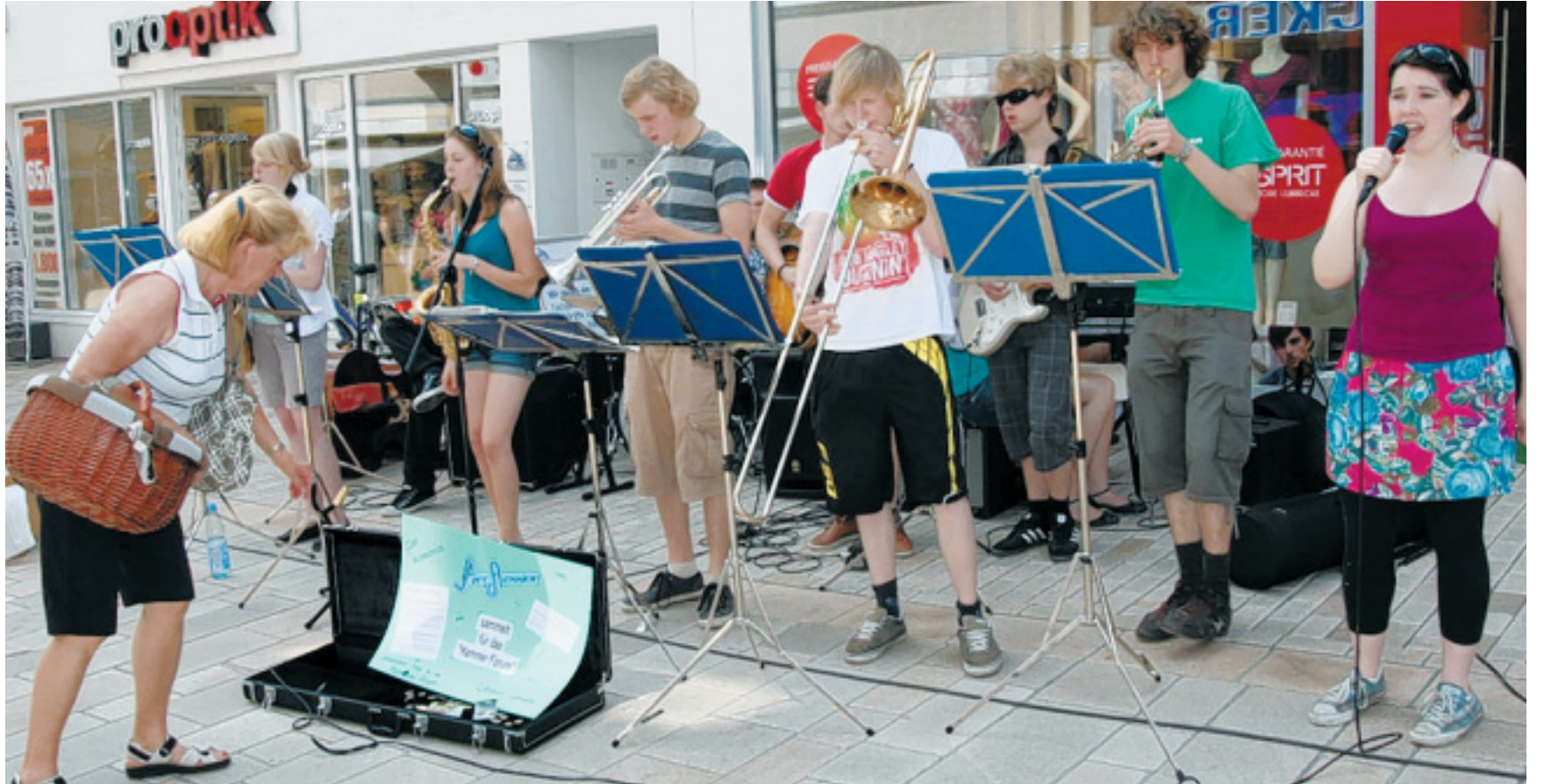
Spielten und sangen für den guten Zweck: Zahlreiche Passanten wussten Musik und Engagement der zwölf Wittekind-Gymnasiasten zu schätzen und warfen Münzen und Scheine in den Sammelkasten.